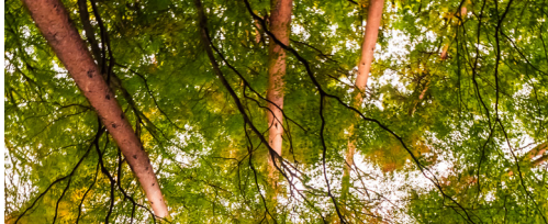
SUR LES GRILLES DU PARC JOUVET (GAMBETTA) : EXPOSITION PHOTOS SUR LES ARBRES REMARQUABLES DE VALENCE ET DE LA DRÔME

Notre objectif est de vous associer à notre initiative en faveur de l'arbre. Sensibiliser, partager, agir : la nature a plus que jamais besoin de nous tous à Valence.